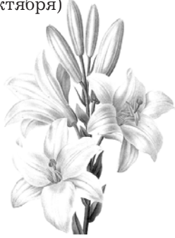
Мама, сестра и ее семья

С Юбилеем поздравляем И желаем от души, Чтоб была всегда здоровой, Чтоб сбывались все мечты! Пусть проходят год за годом - Не печалься никогда! Пусть все беды за порогом Остаются навсегда! Твоя жизнь пусть будет сказкой, А глаза не знают слез, С Юбилеем, дорогая, Принимай букет из роз!